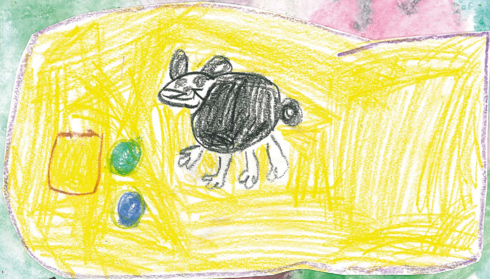
Křeček v domečku.